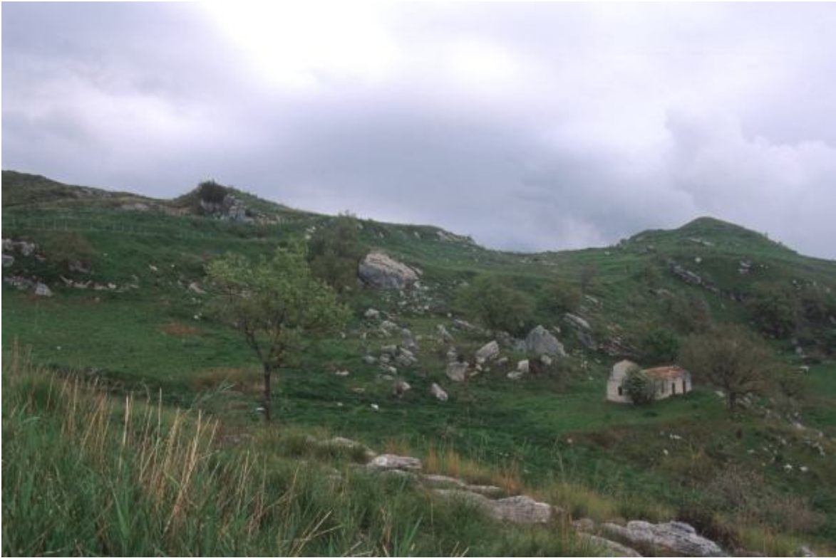
Lato nord de sito