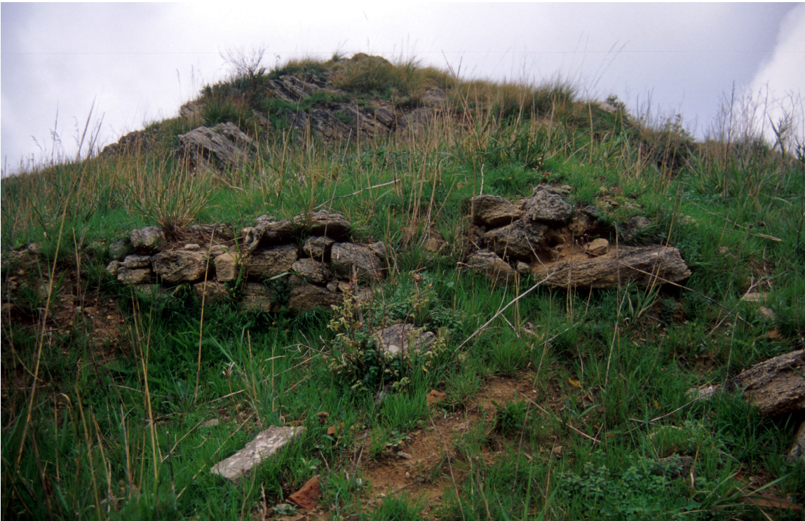
Lato ovest particolari del sito archeologico