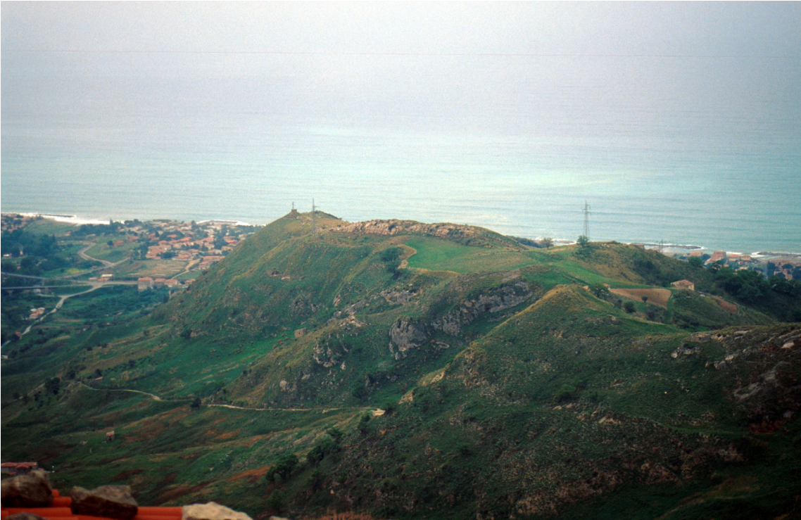
lato sud ovest della timpa di Civita